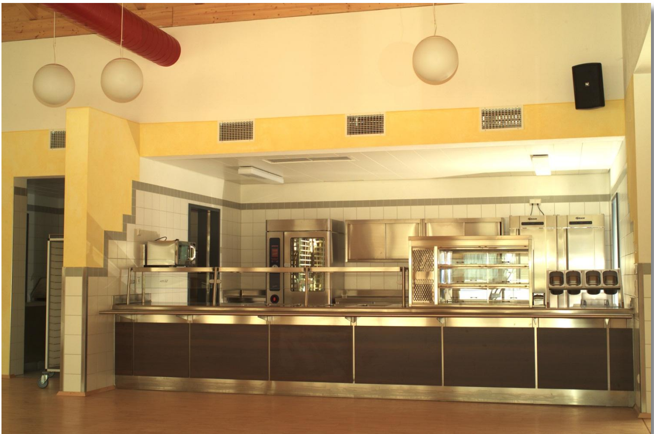
AUSGABEANLAGE, LINKS EINGANG ZUR SPÜLKÜCHE